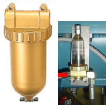
Sondertypen auf Anfrage

Ablass: je nach Anforderung: Std = Anschlußgewinde, optional Ablasschraube