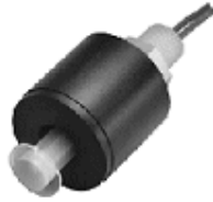
Buna N Schwimmer

Bestens geeignet für Öle und Treibstoffe.