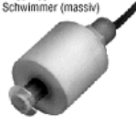
Polypropylen Schwimmer (massiv)

Schaltrohr und Schwimmer aus Polypropylen, diese Schalter sind in den meisten Chemikalien einsetzbar.